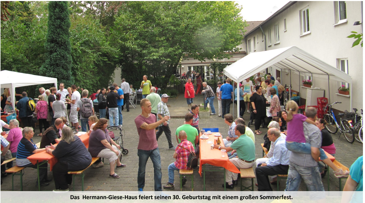
Das Hermann-Giese-Haus feiert seinen 30. Geburtstag mit einem großen Sommerfest.

Großes Sommerfest am 2. September von 12 bis 17 Uhr in der Schmitzbauerstraße 9